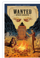
WANTED. RETRATO SANGRIENTO BORIAU/ DHONDT