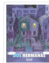
DOS HERMANAS SIVAN/ DUHAMEL