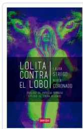
LOLITA CONTRA LOBO AA.VV.