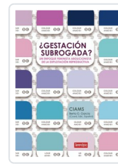
GESTACION SUBROGADA? UN ENFOQUE ABOLICIONISTA DE LA EXPLOT AA.VV.