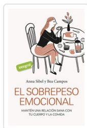
SOBREPESO EMOCIONAL, EL SIBEL, ANNA / CAMPOS, BEA