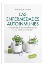
ENFERMEDADES AUTOINMUNES, LAS GUERRERO, ROSA