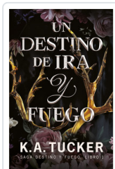
UN DESTINO DE IRA Y FUEGO (SAGA DESTINO Y FUEGO, 1) TUCKER, K.A.