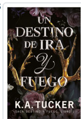
UN DESTINO DE IRA Y FUEGO (SAGA DESTINO Y FUEGO, 1) TUCKER, K.A.