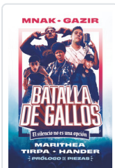
BATALLA DE GALLOS. EL SILENCIO NO ES UNA OPCION MNAK/ GAZIR/ MARITHEA/ TIRPA/ HANDER