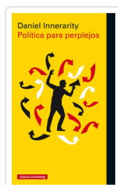
POLITICA PARA PERPLEJOS INNERARITY, DANIEL