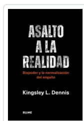
ASALTO A LA REALIDAD DENNIS, KINGSLEY L.