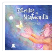
ESTRELLAS DE MANTEQUILLA PORTO, ISABEL