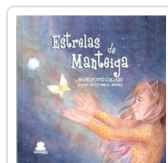
ESTRELLAS DE MANTEIGA PORTO, ISABEL