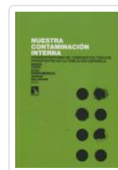
NUESTRA CONTAMINACION INTERNA PORTA, MIQUEL