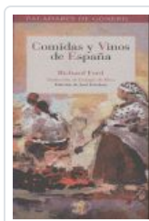
COMIDAS Y VINOS DE ESPAÑA FORD, RICHARD