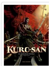
KURO-SAN, 2 EL SAMURAI NEGRO GLORIS/ ZARCONÉ