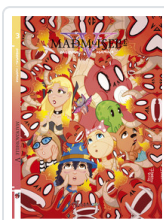
MADEMOISELLE V, 3 ENEBRAL/ MARINA