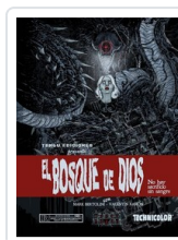
BOSQUE DE DIOS. NO HAY SACRIFICIO SIN SANGRE BERTOLINI/ RAMON