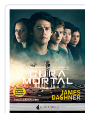
CORREDOR LABERINTO, 3 CURA MORTAL DASHNER, JAMES