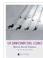
SINFONIA DEL LOBO, LA POPESCU, MARIUS