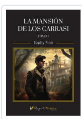
MANSION DE LOS CARRASSI (TOMO I) PINO, SOPHY