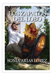
ZAPATOS DEL LOBO, LOS ARIAS, SONIA