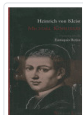
MICHAEL KOHLHAAS VON KLEIST, HEINRICH