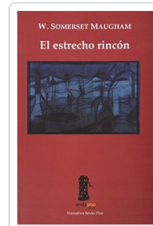
ESTRECHO RINCON MAUGHAM, SOMERSET