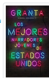
GRANTA ESPAÑOL NE. 8 MEJORES NARRADORES EE.UU. AA.VV.