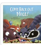
COME BACK OUT, MOLE! ACOSTA, ALICIA