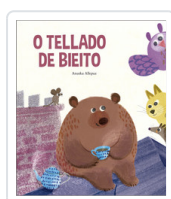
O TELLADO DE BIEITO ALLEPUZ, ANUSKA