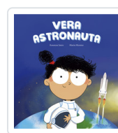
VERA ASTRONAUTA ISERN, SUSANNA