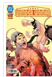
WONDER WOMAN, 3 AA.VV.