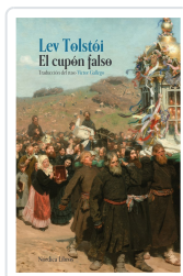
CUPÓN FALSO, EL (NÓRDICA CLÁSICOS) TOLSTOI, LEV