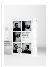
ESTUCHE CUADERNOS DE TRABAJO I Y II BERGMAN, INGMAR