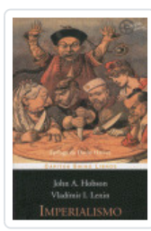
IMPERIALISMO HOBSON, JOHN