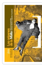
ORIGENES DE LA MAFIA DE TOCQUEVILLE, ALEXIS