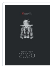
AGENDA NEGRA 2020 AA.VV. (AGENDA)