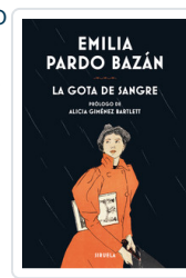
GOTA DE SANGRE, LA PARDO BAZAN, EMILIA