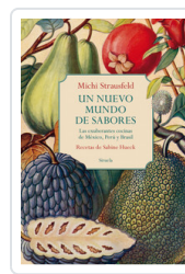
UN NUEVO MUNDO DE SABORES. EXUBERANTES COCINAS MEXICO, PERU STRAUSFELD, MICHI/ HUECK, SABINE