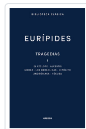
TRAGEDIAS I. EL CICLOPE. ALCESTIS. MEDEA. LOS HERACLIDAS. H EURIPIDES