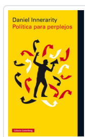
POLITICA PARA PERPLEJOS INNERARITY, DANIEL