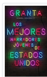
GRANTA ESPAÑOL NE, 8 MEJORES NARRADORES EE.UU. AA.VV.