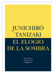
ELOGIO DE LA SOMBRA, EL TANIZAKI, JUNICHIRO