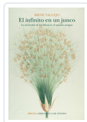
INFINITO EN UN JUNCO. INVENCION DE LIBROS EN MUNDO ANTIGUO VALLEJO, IRENE