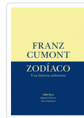
ZODIACO. UNA HISTORIA MILENARIA CUMONT, FRANZ