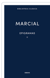
EPIGRAMAS II MARCIAL