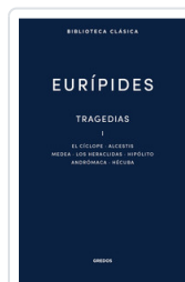
TRAGEDIAS I. EL CICLOPE. ALCESTIS. MEDEA. LOS HERACLIDAS. H EURIPIDES