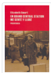
EN GRAN CENTRAL STATION SMART, ELIZABETH