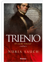
TRIENIO. EL SUÑO LIBERAL SAUCH, NURIA