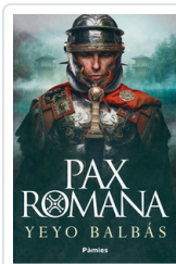
PAX ROMANA BALBAS, YEYO