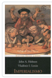
IMPERIALISMO HOBSON, JOHN