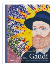
ASI ES... GAUDÍ CLAYPOOL/ CHRISTOFOROU