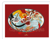
CUATRO DRAGONES ACEVEDO, DESIREE