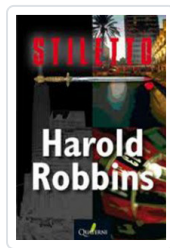
STILETTO ROBBINS, HAROLD