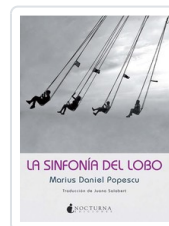
SINFONIA DEL LOBO, LA POPESCU, MARIUS