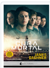
CORREDOR LABERINTO, 3 CURA MORTAL DASHNER, JAMES