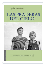
PRADERAS DEL CIELO STEINBECK, JOHN