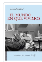
MUNDO EN QUE VIVIMOS BROMFIELD, LOUIS