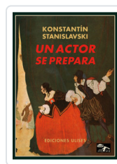
UN ACTOR SE PREPARA STANISLAVSKI, K.