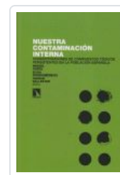
NUESTRA CONTAMINACION INTERNA PORTA, MIQUEL