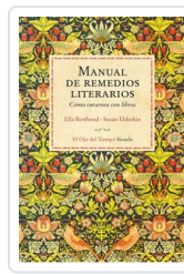
MANUAL DE REMEDIOS LITERARIOS (R) BERTHOUD, ELLA/ ELDERKIN, SUSAN