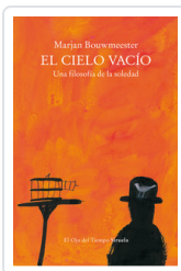
CIELO VACIO, EL BOUWMEESTER, MARJAN