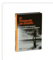
FOTOGRAFO DE BOLSILLO, EL KUS, MIKE