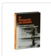
FOTOGRAFO DE BOLSILLO, EL KUS, MIKE