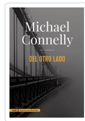
DEL OTRO LADO (ADN) MICHAEL CONNELLY