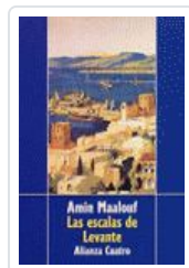
ESCALAS DE LEVANTE AMIN MAALOUF