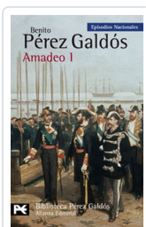
AMADEO I BENITO PEREZ GALDOS