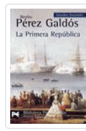
PRIMERA REPUBLICA BENITO PEREZ GALDOS