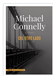
DEL OTRO LADO (ADN) MICHAEL CONNELLY