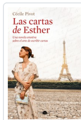
CARTAS DE ESTHER, LAS PIVOT, CECILE