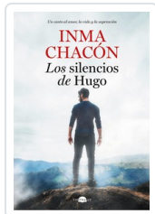
SILENCIOS DE HUGO, LOS CHACÓN, INMA