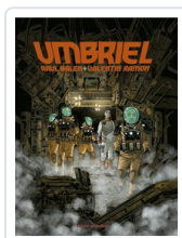
UMBRIEL BALEN/ RAMON