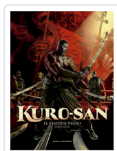
KURO-SAN, 2 EL SAMURAI NEGRO GLORIS/ ZARCONE