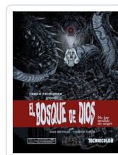
BOSQUE DE DIOS. NO HAY SACRIFICIO SIN SANGRE BERTOLINI/ RAMON