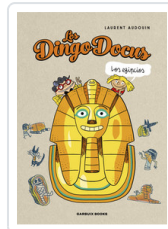
DINGO DOCUS. LOS EGIPCIOS AUDOIN, LAURENT