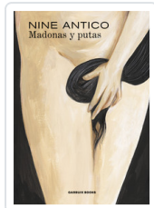
MADONAS Y PUTAS ANTICO, NINE