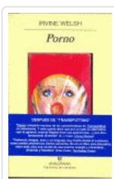
PORNO. WELSH, IRVINE