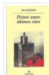
PRIMER AMOR, ÚLTIMOS RITOS