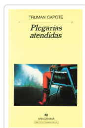
PLEGARIAS ATENDIDAS CAPOTE, TRUMAN