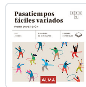
PASATIEMPOS FACILES VARIADOS. PURA DIVERSION SESE, MIQUEL