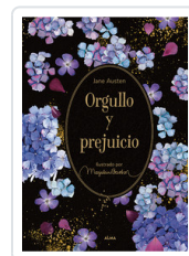
ORGULLO Y PREJUICIO (EL JARDIN SECRETO) AUSTEN, JANE