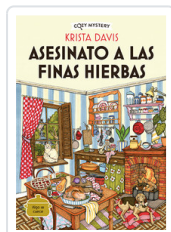
ASEGINATO A LAS FINAS HIERBAS (COZY MYSTERY) DAVIS, KRISTA