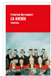
AVERIA, LA DURRENMATT, FRIEDRICH