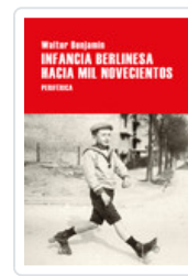
INFANCIA BERLINESA HACIA MIL NOVECIENTOS BENJAMIN, WALTER