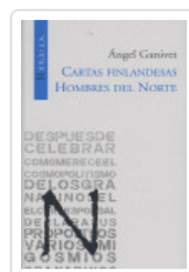
CARTAS FINLANDEAS GANIVET, ANGEL