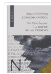
COMEDIA ONIRICA / NOCHE TRIBADAS STRINDBERG, AUGUST