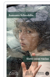
SIETE CASAS VACIAS SCHWEBLIN, SAMANTA